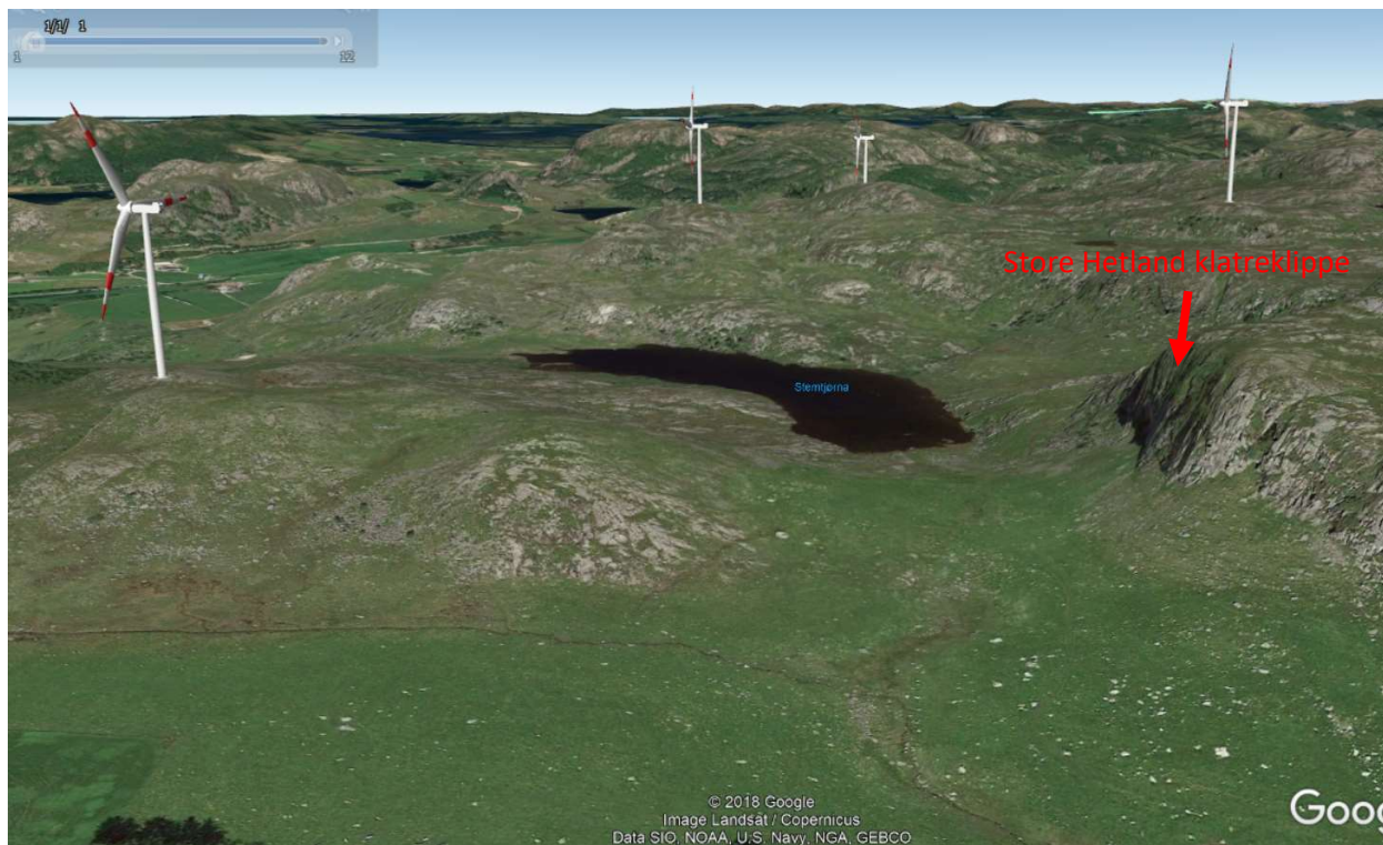
Figur 2 Store Hetland vs Vardafjell vindkraftverk

I samme vindkraftverk finner vi også klatrefeltet Store Hetland. Dette ligger i et hittil urørt område hvor en kunne være mutters alene med de utfordringene fjellet byr på, og likevel innen kort avstand fra «sivilisasjonen» i Sandnes og resten av Nord-Jæren. Nå: