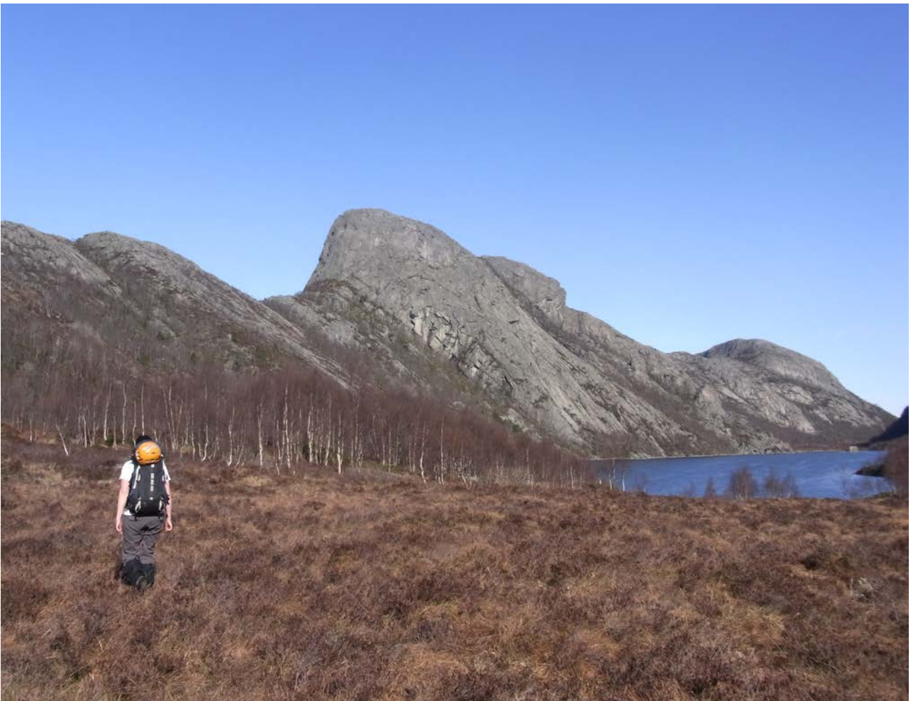
↑ Anmarsj til Kjørkjestafjellet